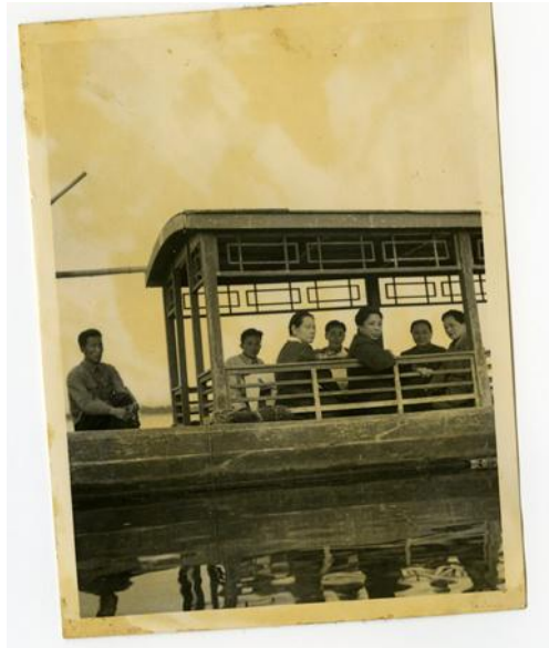
宋庆龄、廖梦醒、黎沛华等在北京公园游湖时留影。

何香凝进入九十高龄后，一直病患不断。回到上海后的黎沛华，一直牵挂着年事已高的何香凝，经常去信问候。好友廖梦醒知其牵挂，总将母亲情况一一禀告。1970年五一前夕，何香凝不慎跌倒，又感染肺炎住院治疗，好在到10月出院时已基本痊愈，精神尚好。廖梦醒高兴地写信告诉好友“母亲自十一出院后，当日还上了天安门，下来后一回家，精神已日渐恢复。虽然只能卧床不起身，但在床中看史记，参考，都头头是道，也很关心国家大事，除却不能坐起之外，都和跌伤前无大异。请舒远念”。 63 不久，何香凝再次因病住院，数月后病情又突然恶化。心乱如麻的廖梦醒立即写信给黎沛华：“医生已通知我们要有精神准备”，“知你关注，并告诉这个消息。” 64 一个月后，何香凝还是“一点精神也没有”，“有时昏昏沉沉地睡”。 65 但很快就有了起色。看到母亲病情好转，廖梦醒又兴奋地给黎沛华写信：“昨天去看母亲，居然在看《史记》，母亲的嘴唇比我的红，面色亦都比我好看。我有此好消息，如何能不马上给你写信呢？我告诉她你问候她，你的信也送去了医院。” 66