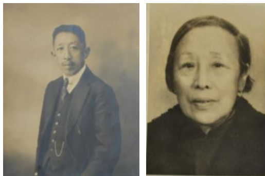
黎沛华保留的廖仲恺、何香凝照片

由于宋庆龄身边缺乏合适的秘书，何香凝便向她推荐了黎沛华。从4月开始，黎沛华正式担任宋庆龄的秘书，“追随宋庆龄先生做一些工作，如在中国民权保障同盟工作等”。 50 虽然专任宋庆龄的秘书，但她与何香凝依然私交甚好。在抗日救亡的时代背景下，宋庆龄开展的一系列救亡活动，何香凝也是当然的组织者、领导者或参与者。因此，黎沛华与何香凝之间于公于私始终有着密切的交往。1935年初，国民政府决定为廖仲恺举行国葬，将他的墓由广州迁葬南京中山陵。6月18日，当灵柩运抵南京时，国民党将领、中央军校学生，以及各界代表5、6千人到车站迎接。当时，黎沛华专程到南京，与刘蘅静、黄佩兰、刘天素等原妇女部的人员一起来到何香凝的身边，向她致意，使抱病南下又护柩到京的何香凝甚感宽慰。 51