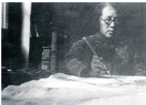
1931 年，何香凝为义卖作画，支援抗日战争。

集会议，商酌销券及募集书画事宜。 37 何香凝登高一呼，立即得到了上海、北平、广州、南京等地书画界的积极响应，仅一周时间便征得书画 1500 余件，何香凝、陈铭枢、柳亚子、叶恭绰、王一亭、王晓籁等还认购捐款达 1 万余元。 38 华侨巨商胡文虎也就此书画义展义卖，表示捐献飞机 2 架，以为助何香凝办理抗日救护之用。 39 12 月 28—31 日，“救济国难书画展览会”在上海西藏路宁波同乡会大厦（今西藏中路 480 号）开幕。展览不收取门票，出售的展览券分为 30 元、2 元、1 元 3 种，参观时可选购书画。 40 书画展览会取得了很大成功，“售券及卖画共收款两万两千余元，除去开支一千八百余元及捐助马占山将军等抗日各团体救伤药费一千三百余元外，尚存一万八千八百六十五元有零”。 41