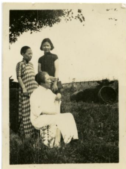
黎沛华与何香凝、廖梦醒（何香凝女儿）合影

何香凝与黎沛华同为广东人，她们相识于大革命时期的广州。上世纪 20—30 年代，何香凝是中国妇女运动的先驱，是抗日救亡的领袖，是叱咤风云的女中豪杰；黎沛华则是她手下的得力干将，是她最为信赖和倚重的秘书，也是她志同道合的同志和朋友。