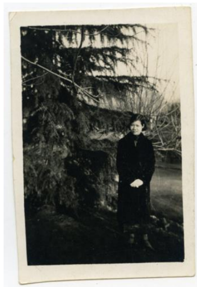
上世纪二三十年代的黎沛华

自创刊起，《妇女之声》就是中央妇女部唯一的机关刊物。黎沛华作为妇女部的秘书，自然责无旁贷地担任主编，负责编印工作。