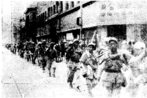
1949年5月25日黎明，人民解放军进入市区越过南京路