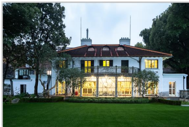
今淮海中路1843号上海宋庆龄故居纪念馆主楼

宋庆龄刚刚从香山路7号（今上海孙中山故居纪念馆）移居林森中路1803号。由于是敏感时期搬的家，关于宋庆龄的谣言又沸沸扬扬地传播开来。谣言说宋庆龄离开了自己的家，躲到朋友家中去了。但是林森中路1803号原本就是国民政府拨给的，宋庆龄也没有偷偷摸摸搬家，她还在新家邀请朋友们前来做客。5月12日上海战役打响后，19日，妹妹美龄和二弟子良联名从美国来信。他们说：“最近，我们都经常想起你，考虑到目前的局势，我们知道你在中国的生活一定很艰苦，希望你能平安、顺利。”亲人们早就陆续离开了祖国大陆，只有宋庆龄独自坚守上海与黑暗抗争，等待黎明到来。