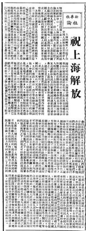
毛泽东为新华社修改的 1949 年 5 月 29 日新华社社论《祝上海解放》

宋庆龄在海内外具有广泛影响，在艰难困苦的革命岁月中，她长期与中国共产党合作，为缔造新中国做出了特殊而杰出的贡献。在极其艰辛危机的非常时期，她坚守着自己的阵地，积极准备欢迎中国人民解放军，欢迎中国共产党，组织和领导上海人民应付意外，为迎接上