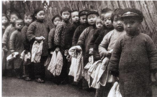
中国福利基金会儿童福利站向贫苦儿童发放大米

1949年5月25日，解放军首先解放了苏州河南岸。解放前的最后一晚，四周特别寂静，既无炮声，也没有火光，人们对这突然的安静有点纳闷，有人已经推断出可能当晚便是解放上海的时候。这一晚，很多人没有入睡，住在林森中路1803号（今淮海中路1843号上海宋庆龄故居纪念馆）的宋庆龄也在黑暗中静静地等待着。