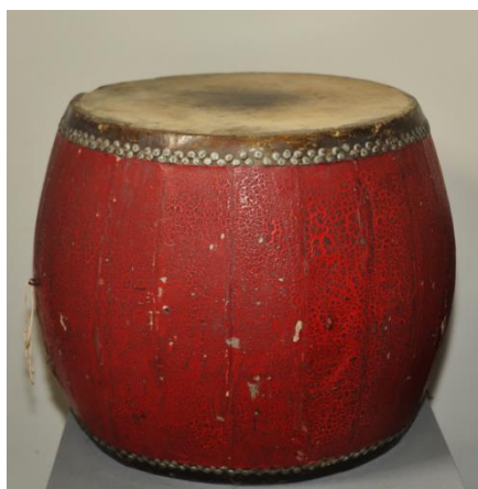
儿童剧团庆祝上海解放时使用的大鼓

这天清晨，宋庆龄派了一辆大卡车来到了位于横浜桥的中国福利基金会儿童剧团本部，把儿童剧团的表演队接到了位于安福路的上海影剧界集合点。在地下党文委的领导下，儿童剧团的表演队走上街头，34名少男少女边游行，边扭秧歌、打莲湘，欢庆上海解放。人们拍手欢迎说：“孙夫人的秧歌队来了。”中国福利基金会儿童福利站的“小先生”们也组织了宣传队，高唱着《我们的队伍来了》奔向街头，欢迎人民解放军。市民们挤满街头，驻足观看，为儿童剧团表演队的表演鼓掌喝彩。