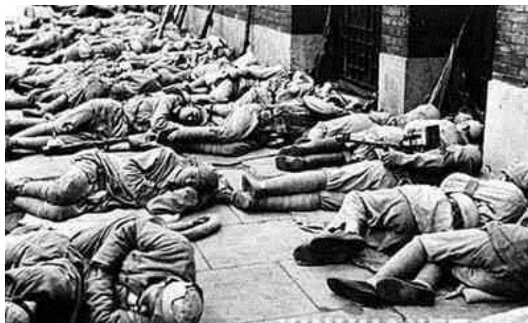
全副武装露宿上海街头的解放军战士

1949年5月27日清晨，当上海市民打开家门的时候，发现下着雨的路面上睡满了解放军战士。上海市民对胜利之师全副武装露宿街头的情景闻所未闻，整个城市轰动了。