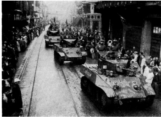
1949年5月25日，人民解放军坦克部队经过南京路

宋庆龄刚刚从香山路7号（今上海孙中山故居纪念馆）移居林森中路1803号。由于是敏感时期搬的家，关于宋庆龄的谣言又沸沸扬扬地传播开来。谣言说宋庆龄离开了自己的家，躲到朋友家中去了。但是林森中路1803号原本就是国民政府拨给的，宋庆龄也没有偷偷摸摸搬家，她还在新家邀请朋友们前来做客。5月12日上海战役打响后，19日，妹妹美龄和二弟子良联名从美国来信。他们说：“最近，我们都经常想起你，考虑到目前的局势，我们知道你在中国的生活一定很艰苦，希望你能平安、顺利。”亲人们早就陆续离开了祖国大陆，只有宋庆龄独自坚守上海与黑暗抗争，等待黎明到来。