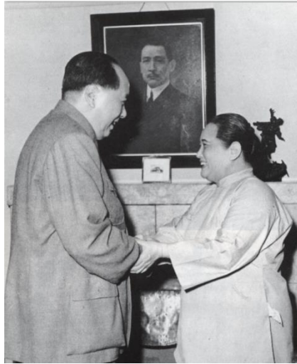
1961年5月11日，毛泽东在上海宋庆龄住所看望宋庆龄

参加新政府又继续进行了周密安排。其中一个令宋庆龄非常高兴的贴心之举便是将邓颖超留在上海，陪伴宋庆龄于8月份一起北上。周恩来要求邓颖超，在沪逗留期间，“应多往孙夫人处谈话，为之讲解各种情况和我党政策。”