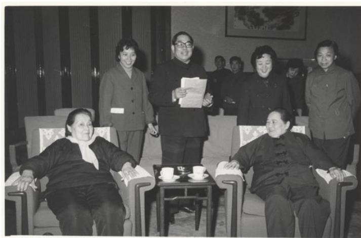
1980 年 3 月 8 日，宋庆龄在人民大会堂与史良谈话。后排为工作人员

上海解放后，李济深、沈钧儒、章伯钧、黄炎培、张东荪、周新民等民主人士曾陆续致电宋庆龄，恳请其北上，但均被宋庆龄以“病躯急需疗养”为由婉拒了。然而，对于北上之事，她的确认真考虑过。就在史良 6 月 15 日启程北上赴平之前，宋庆龄跟史良讨论过参加政协事，她告诉史良过去香港曾送来毛、周致电，邀请她北上参加新政协，史良听后力主宋庆龄应该参加新政协，即使因病体不能天天到会，也应该到北平参加开幕式。宋庆龄闻之动容，请史良由平回沪后与她商决。