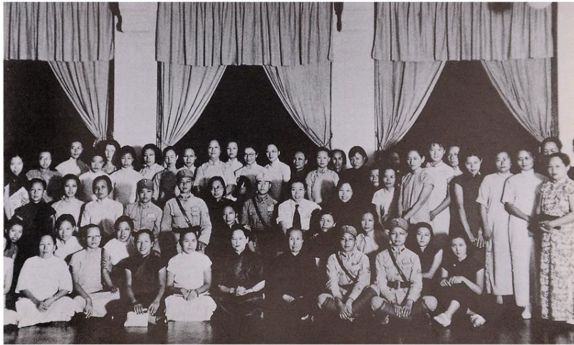
1938年9月15日，宋庆龄在广州各界妇女欢迎集会上与各界代表及女界领袖合影。二排左九为邓颖超

6月25日，邓颖超偕廖梦醒抵达上海。廖梦醒是廖仲恺、何香凝夫妇的女儿，曾长期担任宋庆龄的英文秘书、深得宋庆龄信任。邓颖超让廖梦醒先去和宋庆龄打个招呼，然后她再去拜见。是日，当廖梦醒身穿灰布制服，头戴灰布军帽出现在宋庆龄面前时，宋庆龄还以为来了一个女兵。廖梦醒叫了一声“Aunty”，她才发现是廖梦醒，于是笑了起来。