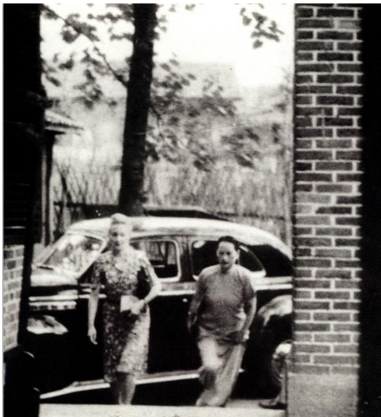
1945年9月8日，宋庆龄在王安娜陪同下，赴桂园出席毛泽东、周恩来为招待在重庆的各国援华救济团体负责人而举行的茶话会