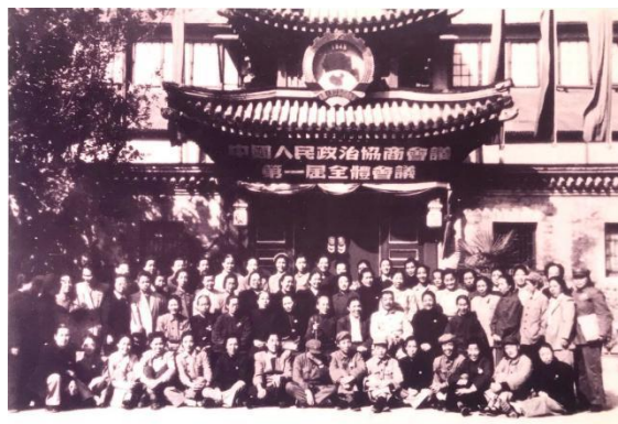
宋庆龄与出席中国人民政治协商会议的女代表合影

行茶会，招待出席中国人民政治协商会议的女代表，宋庆龄、何香凝等 54 位女代表出席了茶会。