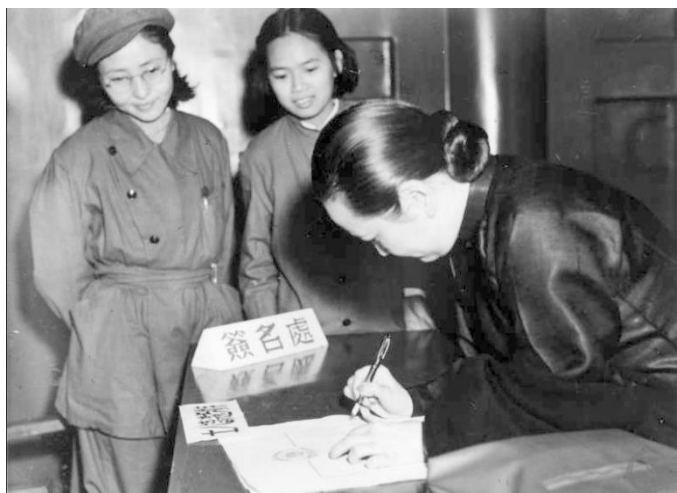
宋庆龄用钢笔签到（右二、右三分别为孙小礼、荆惕华）

1949年9月21日，中国人民政治协商会议第一届全体会议在北京召开。在会议正式召开之前，9月上旬，600多名会议代表陆续来到中南海怀仁堂报到。代表报到的签名纸是白色宣纸，代表签名一律用毛笔。因为宋庆龄不擅长用毛笔，负责宋庆龄报到的两位姑娘孙小礼和荆惕华特意为她精心挑选了一支钢笔。9月19日上午，天气晴朗宜人，宋庆龄由管易文陪同来怀仁堂签到，她用钢笔很工整地写下了自己的名字。随后，两位姑娘目送她走进一辆小汽车，随即驶离怀仁堂。