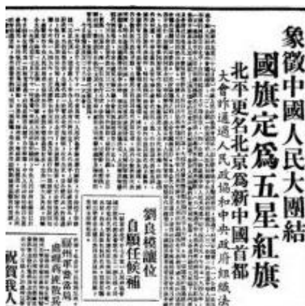
中国人民政治协商会议第一届全体会议于1949年9月27日通过了六项重要议案

9月22日至29日会议期间，中国人民政治协商会议第一届全体会议通过了《中国人民政治协商会议共同纲领》《中国人民政治协商会议组织法》《中华人民共和国中央人民政府组织法》这三个为新中国奠基的历史性文件，并通过了关于国旗、国歌、首都、纪年等决议。