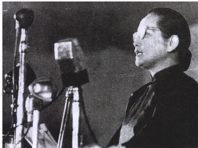
特别邀请代表宋庆龄讲话

随后，中国共产党代表刘少奇、特别邀请代表宋庆龄，以及中国国民党革命委员会代表何香凝等各界代表共12人，在会上相继发表演讲。