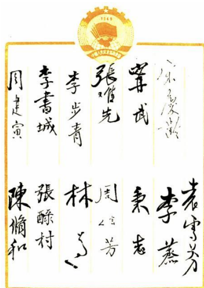
宋庆龄在签名册上的签名