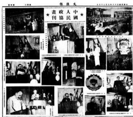
《文汇报》1949 年 9 月 25 日第 4 版载中国人民政治协商会议开幕盛况

9 月 21 日晚 7 时，中国人民政治协商会议第一届全体会议在中南海怀仁堂隆重开幕。出席开幕式的各党派、团体代表 635 人，来宾 300 人。宋庆龄作为特邀代表参加了会议。