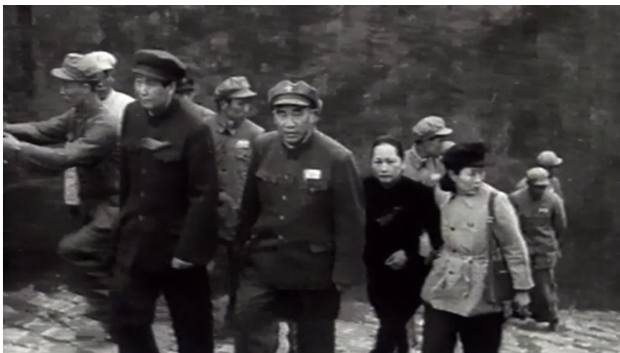
毛泽东、朱德、刘少奇、宋庆龄、周恩来等领导人登上天安门城楼

下午 2 时 50 分，中央人民政府委员会成员分别上车。车队由勤政殿门口开出，绕中南海东门，5 分钟后到达天安门城楼后边。大家互相招呼着集合好，毛泽东在前，宋庆龄紧随毛泽东、朱德之后，沿着长长的 100 个台阶，缓步登上天安门城楼。