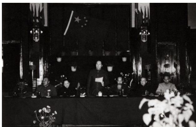
1949年10月1日，在中南海勤政殿举行的中央人民政府委员会第一次会议上。左起：刘少奇、李济深、张澜、毛泽东、宋庆龄、朱德

当天下午2时，中央人民政府委员会第一次会议在中南海勤政殿正式召开。宋庆龄出席了此次会议，并和中央人民政府主席、其他副主席和委员一起就职。中华人民共和国中央人民政府主席毛泽东在会上宣读了《中华人民共和国中央人民政府公告》，宣告中央人民政府成立，接受《中国人民政治协商会议共同纲领》为施政方针，宣布本政府为代表全国人民的唯一合法政府，林伯渠为中央人民政府秘书长，周恩来为政务院总理，毛泽东为军委会主席，朱德为解放军总司令，沈钧儒为最高人民法院院长，罗荣桓为最高人民检察署检察长。