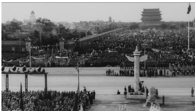
1949年10月1日开国大典，各界群众汇聚在北京天安门广场

1949年10月1日是中国历史开天辟地的一天，中华民族历经了百年沧桑，在这一天迎来了巨变。这一天，北京30万军民聚集在天安门广场，人群、旗帜、鲜花、灯饰汇成了锦绣的海洋。这一天，宋庆龄就任中华人民共和国中央人民政府副主席，怀着激动的心情参加了开国大典。