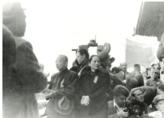
站在天安门城楼栏杆前的宋庆龄

林伯渠宣布中华人民共和国开国大典开始后，毛泽东走到麦克风前，用他那具有伟大历史意义的声音向全世界宣告：“中华人民共和国中央人民政府今天成立了！”顿时，广场上欢声雷动，群情激昂。摆在前门城墙根的 54 门礼炮齐鸣 28 响，象征着中国共产党领导全国人民艰苦奋斗二十八年的光辉历程，震撼人心。这时，林伯渠大声宣布：“请毛主席升国旗。”军乐队奏起了雄壮的《义勇军进行曲》。毛泽东按动升旗电钮，只见人民英雄纪念碑奠基前高高矗立的旗杆上，那面巨大而鲜艳的五星红旗在万众翘首仰望中徐徐升起。