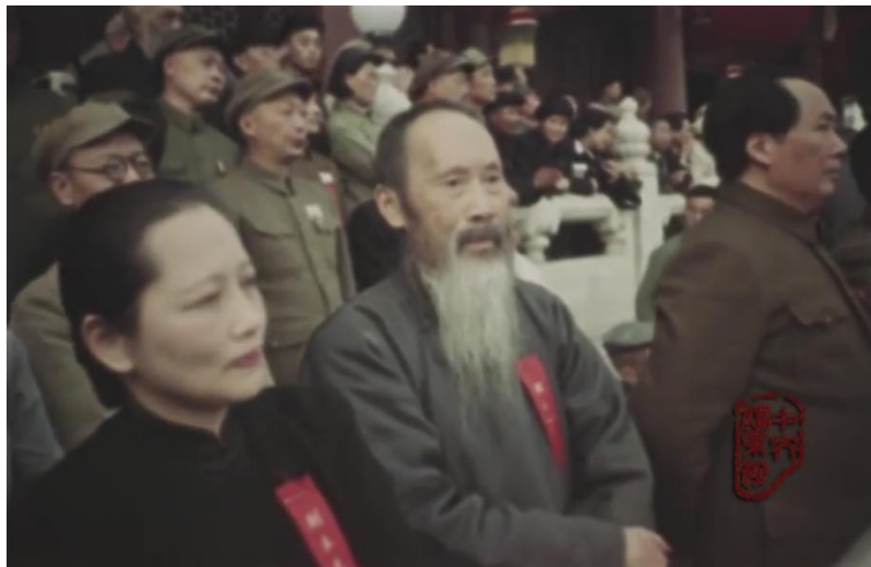
正在天安门城楼上观看阅兵式的宋庆龄

随后朱德检阅中国人民解放军海陆空军，并宣读中国人民解放军总部命令，命令人民解放军全体指战员迅速解放一切尚未解放的国土。