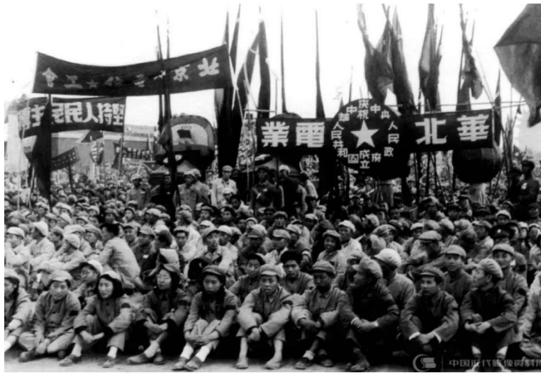
参加开国大典的工人队伍

盛大的阅兵式后，欢乐的游行开始。工人、农民、学生、机关干部和市民，高举红旗花束，载歌载舞地前进着。直到晚上 10 时庆典结束，宋庆龄才同毛泽东、朱德、刘少奇、周恩来这些开国元勋们一起，离开天安门城楼。