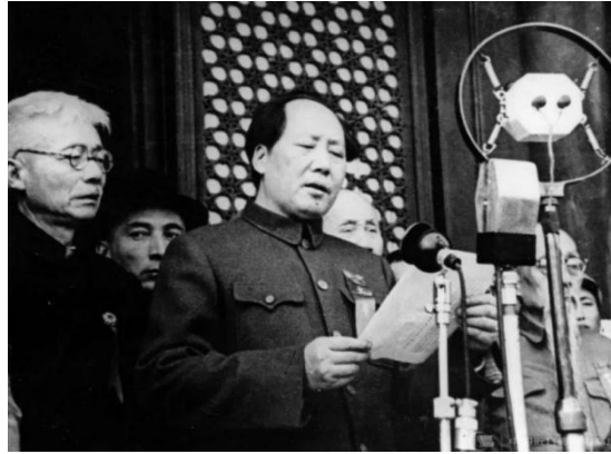
1949 年 10 月 1 日开国大典，毛泽东宣布中华人民共和国中央人民政府成立

四面八方涌来的群众队伍，人们有的擎着红旗，有的提着红灯。到了正午，天安门广场已经成了人的海洋，红旗翻动，像海上的波浪。下午 3 时整，中华人民共和国中央人民政府主席毛泽东和朱德、刘少奇、宋庆龄等副主席及各位中央委员一起出现在天安门城楼主席台上与群众见面。30 万人的目光一齐投向主席台，天安门广场上爆发出一阵排山倒海的掌声。