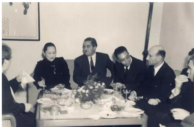
1949年10月18日晚，宋庆龄在上海寓所里举行鸡尾酒会，宴请苏联文化艺术科学工作者代表团

随后代表团一路南下，去往南京、上海、济南等地，在中国刮起了一阵又一阵“苏联旋风”，所到之处欢迎场面热烈隆重。10月15日凌晨2时，代表团一行抵达上海。当天下午，上海各界举行隆重的欢迎集会。10月18日晚，刚刚从北京回到上海仅1天的宋庆龄，就以中央人民政府副主席和中苏友好协会副会长的身份在上海寓所举行鸡尾酒会，热情招待这个代表团的成员。团长法捷耶夫已先行回国，来参加酒会的有西蒙诺夫、格拉西莫夫、瓦尔拉莫夫、杜伯洛维娜、马尔柯夫、费诺格诺夫、阿格拉则、司托烈托夫、德奥米多夫、伏兹尼等十人，苏留沪外交人员符拉其米洛夫也出席。出席的中国宾客有上海市委书记饶漱石和副市长曾山、潘汉年、韦恂等。在挂有孙中山像的会客室内，宾主双方畅谈甚欢。酒会中，宋庆龄向客人们示范如何把筷子当刀叉，格拉西莫夫等也模仿起来。次日代表团离沪赴京时，宋庆龄亲往火车站送行。