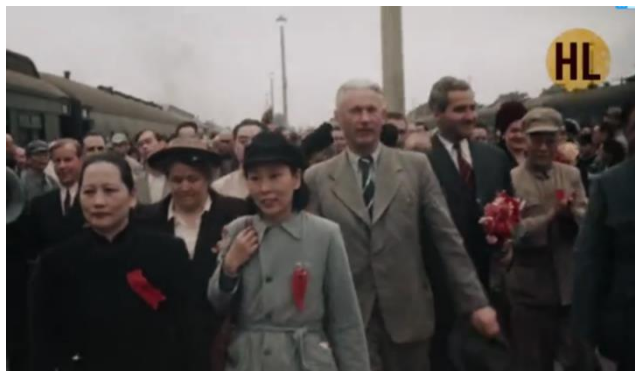
1949年10月1日宋庆龄在北京火车站欢迎苏联文化艺术科学工作者代表团

宋庆龄在电文中提到的苏联文化艺术科学工作者代表团，是苏联政府向新中国派出的第一个代表团。代表团以苏联著名作家法捷耶夫和西蒙诺夫为正副团长，于10月1日上午11时抵达北京火车站。当日上午前往车站欢迎的，有中苏友好协会总会筹委会主任宋庆龄、副主任刘少奇、周恩来、李济深、沈钧儒、黄炎培，副主任兼中国保卫世界和平大会筹委会主任郭沫若，和中苏友好协会总会筹委会总干事钱俊瑞等。各界人士进站欢迎的，共达两百多人。列车进站时，车上车下一片欢呼声。随后在车站举行了欢迎会。在奏了苏联与中国国歌后，周恩来和郭沫若先后致词。头发灰白、高个子的法捷耶夫激动地高呼“中苏伟大人民的永久的友谊万岁！”“中国人民的领袖毛泽东万岁！”“一切先进的和进步的人类的领袖和朋友我们的导师斯大林万岁！”下午，这支苏联代表团应邀参加了中华人民共和国开国典礼，亲眼目睹了中华人民共和国中央人民政府的成立。