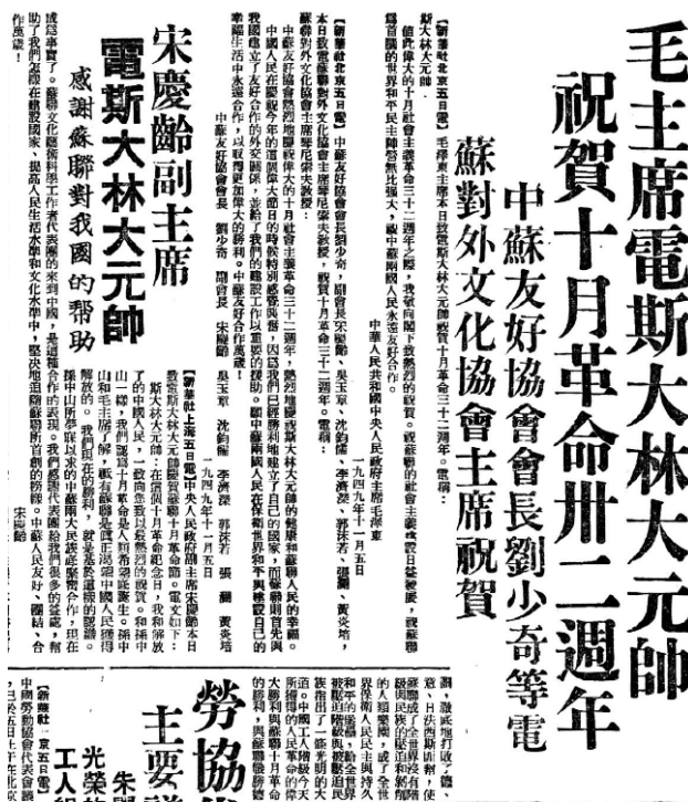
《光明日报》1949年11月6日第一版载《毛主席电贺斯大林大元帅 祝贺十月革命卅二周年中苏友好协会会长刘少奇等电苏对外文化协会主席祝贺》《宋庆龄副主席电斯大林大元帅 感谢苏联对我国的帮助》

11月5日，宋庆龄和中苏友协其他领导人一起，集体致电苏联对外文化协会主席琴尼索夫教授，祝贺苏联十月革命32周年。这一天，新中国领袖以个人名义致电斯大林表示祝贺的有两个人，一个是毛泽东，另一个便是宋庆龄。