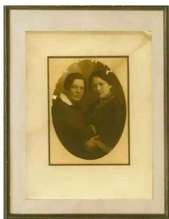
1927年宋庆龄在莫斯科与加里宁夫人的合影

11月7日下午5时40分起，上海市人民广播电台为庆祝十月革命节推出了一系列特别节目。晚8点放送的是中央人民政府副主席、中苏友好协会副会长宋庆龄的演讲——《华北之行所得到的印象》。其中，她讲到：“我深信我们的工人和农民在劳动工作中，决不会比我们伟大友邦苏联的斯塔哈诺夫英雄落后一步。”