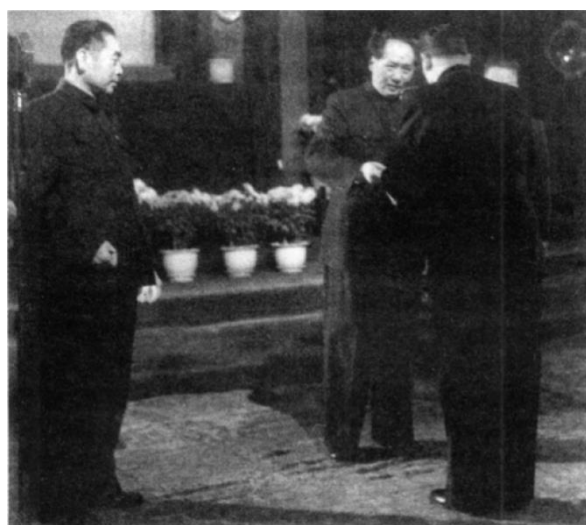
1949 年 10 月 3 日，新中国与苏联建交。10 月 16 日毛泽东接受苏联首任驻华大使罗申送交国书。左为周恩来

“十月革命一声炮响，给中国送来了马克思列宁主义。”1949 年 11 月，新中国第一次迎来苏联十月革命节。苏联是第一个承认中华人民共和国的国家，新中国成立后建立的第一个对外友好协会便是中苏友好协会。