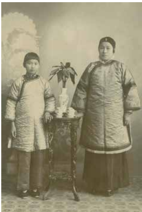
宋庆龄少年时与母亲倪珪贞合影