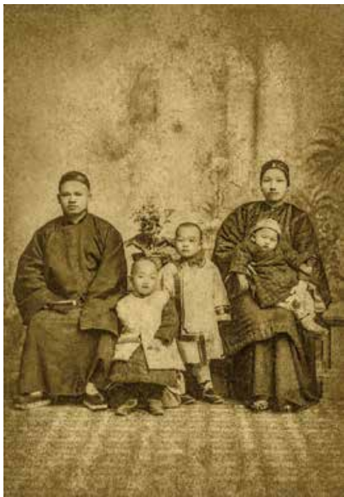
宋庆龄幼年时与家人合影，母亲倪珪贞怀中的婴童推测为宋庆龄。

宋庆龄出生在清朝末年，在父母的安排下自幼接受西式教育，9岁即进入以英文教学的中西女塾读书，14岁远赴美国求学，大学毕业后不久投身于民主革命。基于宋庆龄的受教育状况和成长经历，推测她对于中国传统的女红是不擅长的，即使在幼年时有所接触，之后长期的海外求学生涯以及颠沛流离的革命生活也不可能让她有机会重拾女红活计。