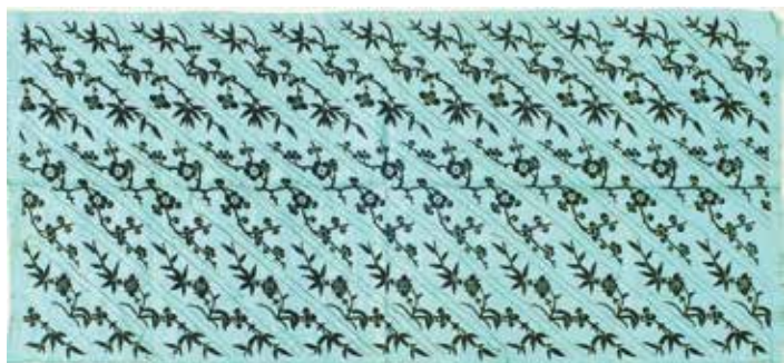
倪珪贞留给宋庆龄 的绣品花边