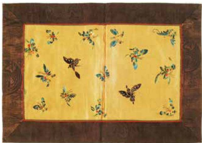
倪珪贞留给宋庆龄 的绣品