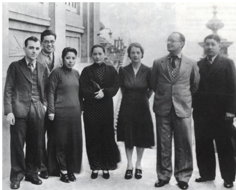
1938年保卫中国同盟中央委员会部分成员在香港合影，左起：爱波斯坦、邓文钊、廖梦醒、宋庆龄、希尔达·塞尔温-克拉克、诺曼·法朗士、廖承志

全国抗战爆发后，中国共产党领导八路军和新四军等抗日武装，挺进抗日前线对日作战，并大胆深入敌后开辟抗日根据地。中国共产党领导的敌后抗日根据地普遍缺乏必需的战时物资及经费，更缺少医生、医疗设备和药物。1938年6月14日，在八路军驻香港办事处的帮助下，宋庆龄正式创办保卫中国同盟，广泛争取国际社会的援助，积极筹集医疗物资与经费，用于支援八路军、新四军以及抗日根据地。