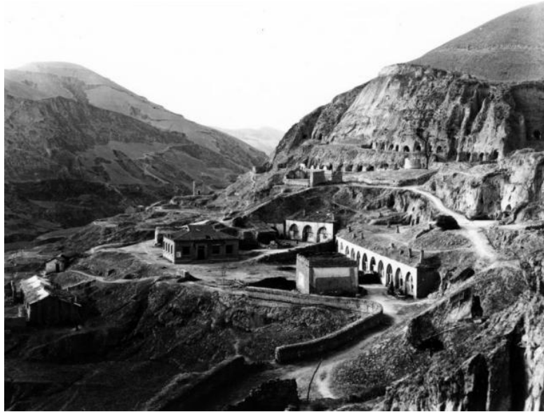
位于延安刘万家沟的白求恩国际和平医院总院全景

宋庆龄还领导保盟帮助边区建立保育院，救助根据地战灾儿童，并资助延安中国抗日军政大学、鲁迅艺术学院等抗日教育机构，以及根据地的难民救济和生产建设等工作。