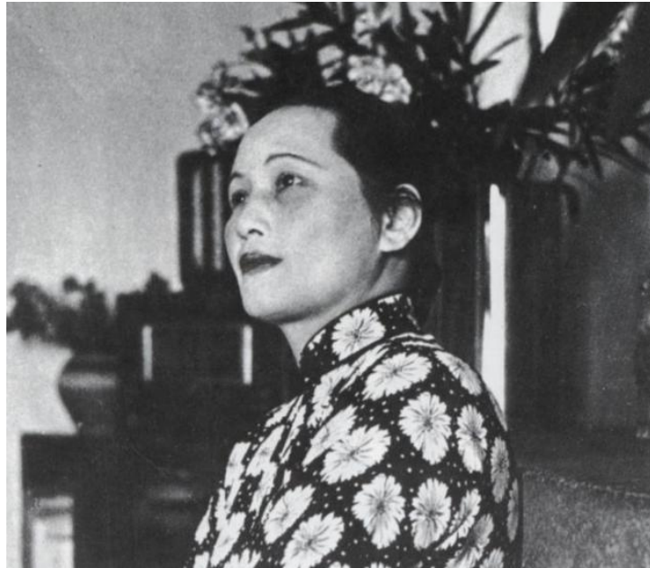
1944年宋庆龄在重庆的留影

任何阻力，任何威胁，都没有、也不能截断你和党的联系。愈在危险艰难的时候，愈显出你同我们党的一致，愈显出你对人民事业的忠诚，愈显出你不畏强暴，不畏威胁的大智大勇，愈显出你是我们党的亲密同志，是完全可以信赖的战友。”