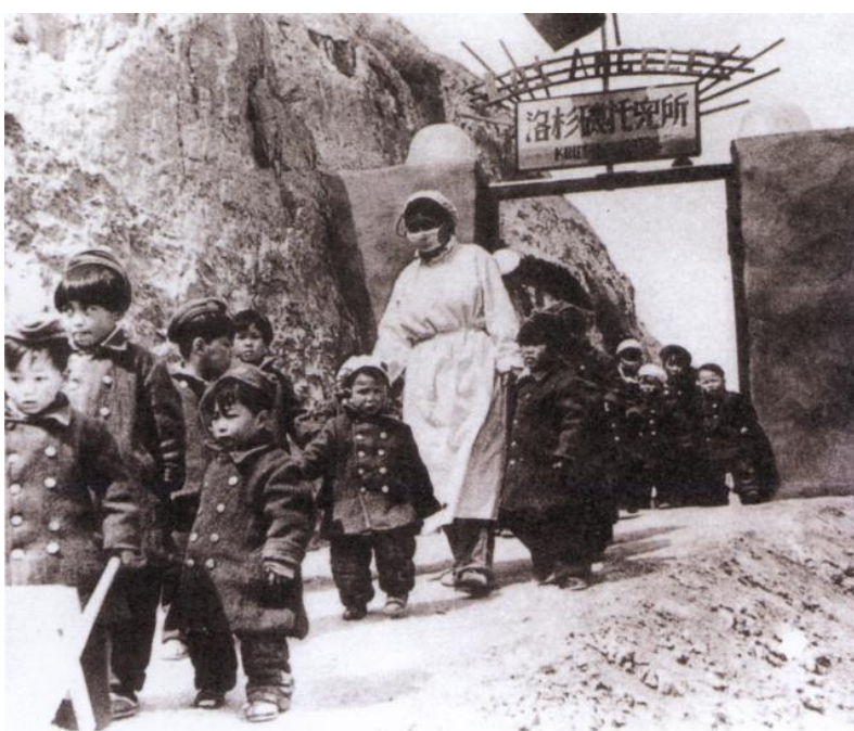
洛杉矶托儿所的孩子们

1942年，延安经济最困难时期，宋庆龄领导保盟联络远在大洋彼岸的洛杉矶爱国华侨及国际友人，组织捐助到了一批药品、玩具、食品及幼儿生活用品，送到了中央托儿所手中。为了感谢爱国华侨的支持，中央决定将“中央托儿所”改名为“洛杉矶托儿所”。