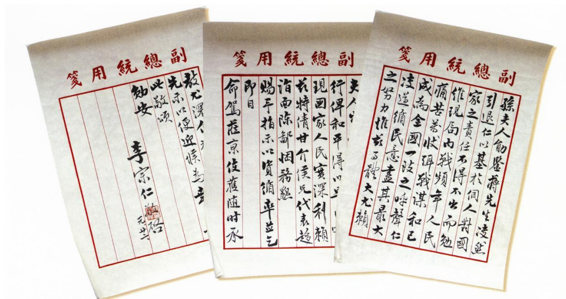
1949年1月22日李宗仁致宋庆龄函（上海宋庆龄故居纪念馆藏）

在历史发展的大转折时期，宋庆龄毫不犹豫地站在中国共产党和广大人民群众一边，坚决支持中国共产党的主张，支持人民的正义斗争。在黑暗与光明的关键决战中，宋庆龄用自己的坚毅勇敢和智慧激情，积极争取和平、民主和解放，最终迎来中国共产党的胜利和新中国的诞生。