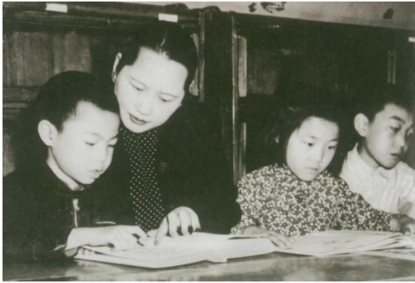
宋庆龄来到儿童福利站看望识字班的孩子们

福利救济团体发起成立“上海临时联合救济委员会”，宋庆龄首先表示把基金会所存物资交出供使用，同时在人力上予以积极支持。