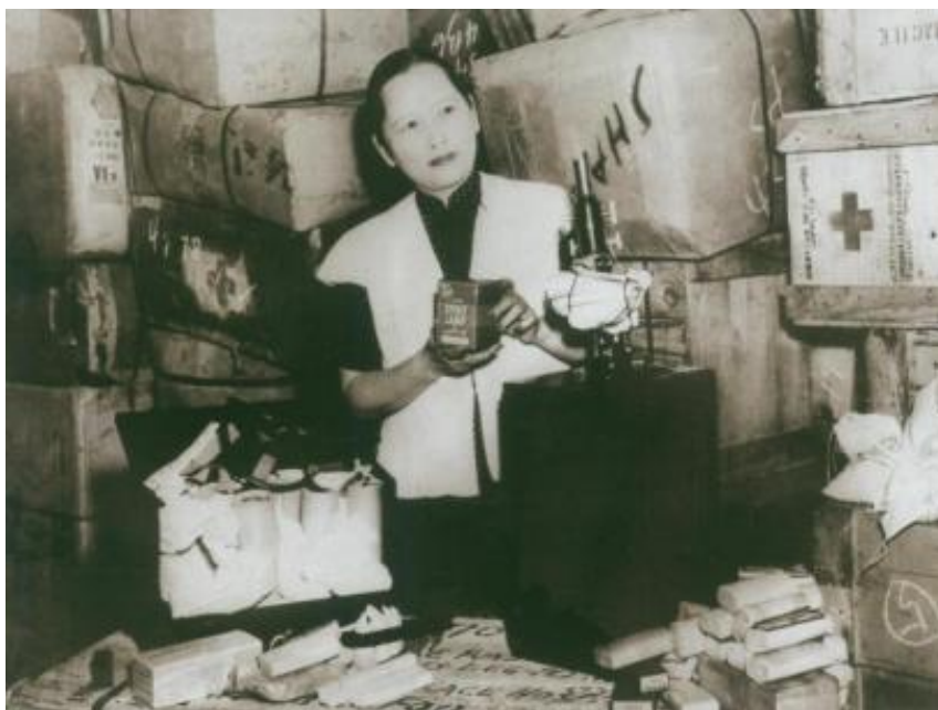
1948年，宋庆龄在检查中国福利基金会准备运往解放区的医药物资

从1945年7月到1946年7月，保盟和基金会运往解放区的医药物资有30吨，1947年筹得捐款约5.4亿元法币送往解放区。宋庆龄还向联合国善后救济总署争取援助，如1946年7月至1947年10月获得救济物资8万多吨送到解放区。当解放战争处于转折点之际，宋庆龄委托国际友人为解放区送去15吨医药物资。1948年将约300吨医疗用品送往解放区。1949年将未及运走的300吨物资拨交中国解放区救济总会。