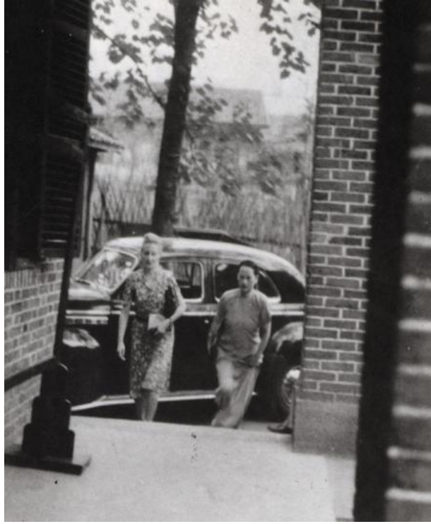
1945年9月8日，宋庆龄在友人王安娜的陪同下赴桂园出席毛泽东、周恩来举行的招待茶会

然而，国民党政府虽然迫于形势，承认了“和平建国”的方针，但它仍然企图通过发动内战来消灭人民革命力量。1945年11月，昆明西南联大等校学生举行反内战运动，但遭到国民党的血腥镇压。一二·一惨案发生后，上海各界于1946年1月13日举行公祭，追悼昆明死难师生，宋庆龄领衔主祭团，并赠送了“为民前驱”的横幅。