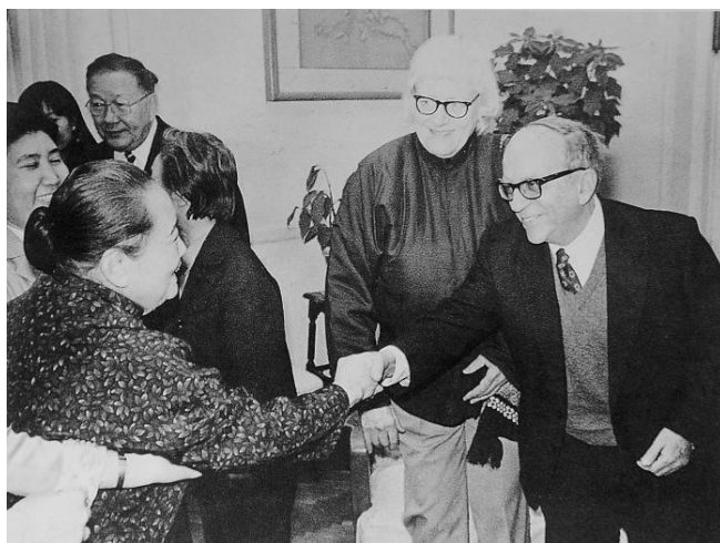
1980年12月2日，宋庆龄在北京寓所会见老朋友 爱泼斯坦（右一）及其夫人邱茉莉（右二）

9月14日，中共中央总书记、国家主席习近平复信斯诺、马海德、艾黎、爱泼斯坦等国际友人的亲属，向那些曾同中国共产党和中国人民风雨同舟、同甘共苦、并肩战斗，为中国革命、建设、改革事业作出宝贵贡献的国际友人致以深切缅怀。其中爱泼斯坦为新中国的国际传播事业做出突出贡献。