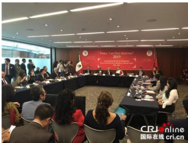
《今日中国》在墨西哥举办“2019 年中国两会·天涯若比邻”主题研讨会

近年，与海外主流媒体展开包括供版供稿、连线采访、举办论坛等方式的合作传播，是《今日中国》秉承宋庆龄国际传播理念推进国际传播工作的又一抓手。十九大以来，《今日中国》在西班牙《国家报》、埃及《金字塔报》《共和国报》、墨西哥《改革报》《宏观经济》等报刊发表稿件百余篇，有效实现中国报道在海外直接落地。同时，通过与海外媒体、智库合作，举办主题论坛、研讨会等双边多边活动，有效拓宽传播渠道、提升传播辐射面。