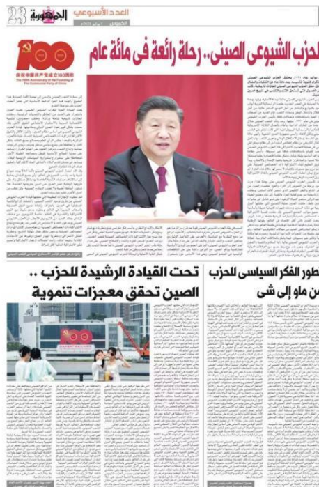
2021 年 7 月，埃及《共和国报》“庆祝中国共产党建党百年”专版

近年，与海外主流媒体展开包括供版供稿、连线采访、举办论坛等方式的合作传播，是《今日中国》秉承宋庆龄国际传播理念推进国际传播工作的又一抓手。十九大以来，《今日中国》在西班牙《国家报》、埃及《金字塔报》《共和国报》、墨西哥《改革报》《宏观经济》等报刊发表稿件百余篇，有效实现中国报道在海外直接落地。同时，通过与海外媒体、智库合作，举办主题论坛、研讨会等双边多边活动，有效拓宽传播渠道、提升传播辐射面。