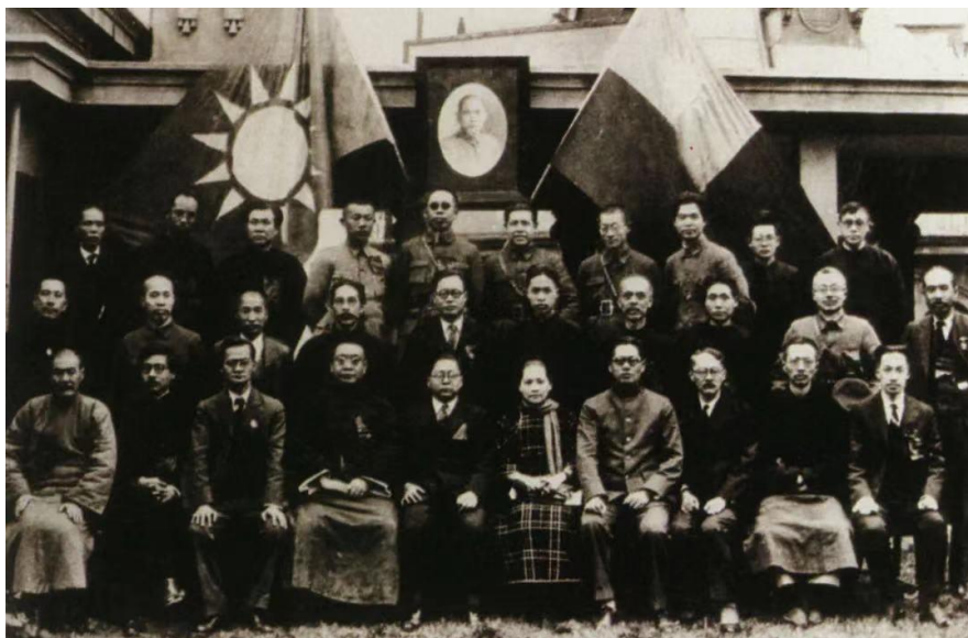
1927年3月，宋庆龄（前排右五）在武汉与出席国民党二届三中全会的部分委员合影

掌握党政军权的蒋介石，反革命面貌开始显露，1926年先后制造“三二〇”事件、“整理党务案”，排挤共产党人。1927年3月，国民党二届三中全会在汉口举行，毛泽东、林伯渠、董必武等共产党员也参加了会议。会上，宋庆龄竭力维护孙中山的革命旗帜和革命政策，立场坚定地坚持国共合作。会议重申“三大政策”和坚持国共合作的革命原则，通过了支持工人运动和限制军事独裁的决议，削弱了蒋介石在党、政、军中的大权。