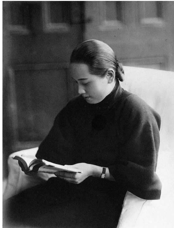
宋庆龄 1927 年在武汉留影

泽东、何香凝等 40 人发表《讨蒋通电》，痛斥其为“总理之叛徒，本党之败类，民众之蠹贼”，给予蒋介石开除党籍并免去本兼各职的严惩，掀起声势浩大的讨蒋运动。