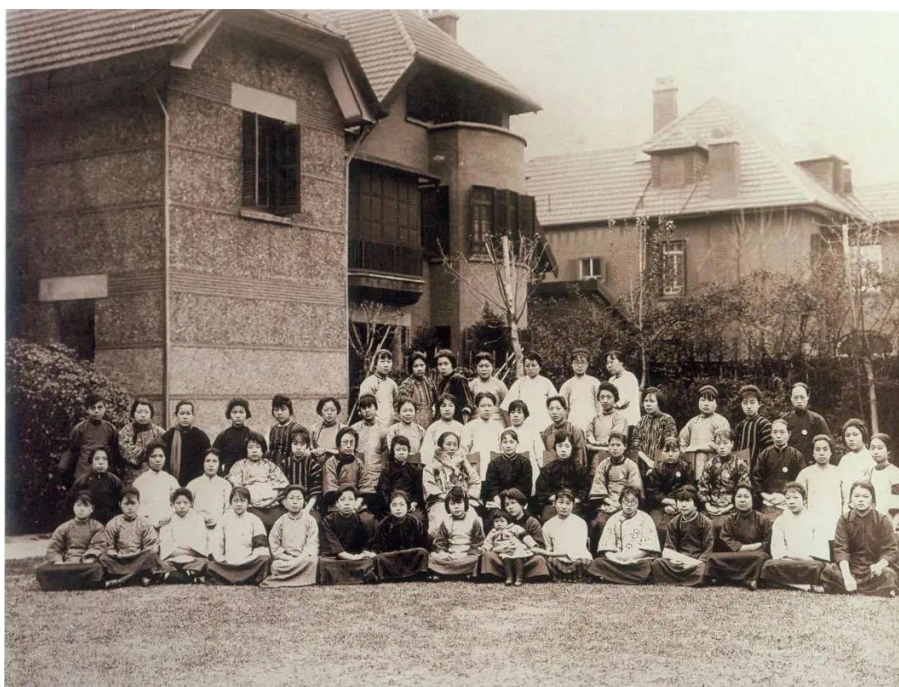
1925年4月17日，国民党上海女党员派代表到莫利爱路寓所慰问刚刚料理完孙中山丧事的宋庆龄（二排右九）

第一次国共合作开创了革命的新局面。毛泽东曾对此作过评论：“孙中山先生致力国民革命凡四十年还未能完成的革命事业，在仅仅两三年之内，获得了巨大成就。”随着革命高潮的到来，统一战线内部的斗争因孙中山的逝世日益加剧。国民党右翼或公然背弃孙中山遗教，或打着三民主义的旗号，大行分共、反共之政策。