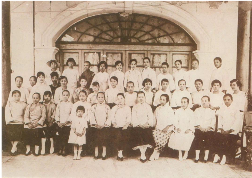
1926年1月20日，宋庆龄在广州出席中国国民党第二次全国代表大会期间，与广州各界妇女欢迎代表合影

掌握党政军权的蒋介石，反革命面貌开始显露，1926年先后制造“三二〇”事件、“整理党务案”，排挤共产党人。1927年3月，国民党二届三中全会在汉口举行，毛泽东、林伯渠、董必武等共产党员也参加了会议。会上，宋庆龄竭力维护孙中山的革命旗帜和革命政策，立场坚定地坚持国共合作。会议重申“三大政策”和坚持国共合作的革命原则，通过了支持工人运动和限制军事独裁的决议，削弱了蒋介石在党、政、军中的大权。