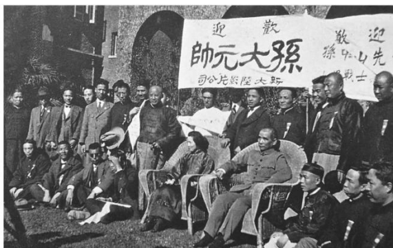
•孙中山与宋庆龄在上海寓所接见各界欢迎代表

孙中山在吃的方面也不讲究，他在南京当大总统时，总统府负责官员的饮食，一般都是三元以上一餐，而孙中山只花四角钱左右一顿。孙中山在上海居住期间，家