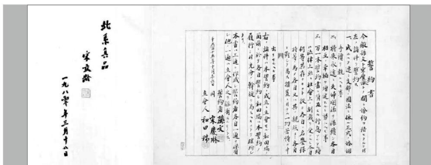
•孙中山和宋庆龄的誓约书