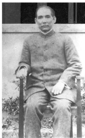
•1917年春，孙中山在上海环龙路寓所

“孙博士沪上法租界之宅，全是西式，以石建筑之二层楼小房。……家中陈设半为中式，惟出于孙夫人之美术布置，颇觉中西折衷，幽美可观。客厅中置一钢琴，盖示其家主妇之雅好音乐也。孙夫人……能操英语，尤较其夫为纯熟。”