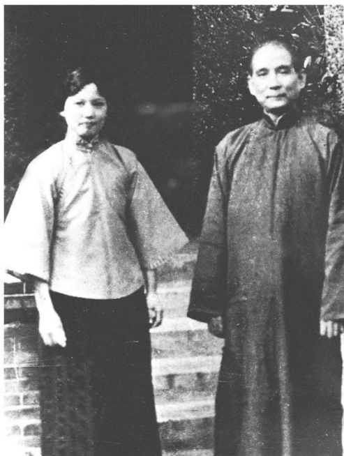
•1922年，孙中山宋庆龄在上海莫利爱路29号寓所前合影

从1840年鸦片战争之后，上海因其在政治、经济、文化等方面的重要影响力，成为国内各派政治势力风云际会的战略要地。上海对于革命领袖孙中山来说更是如此，况且这里是他的夫人宋庆龄的出生地，对孙中山来说更具有不一般的意义。孙中山从青年时代为上书李鸿章在上海中转，至他接受冯玉祥邀请北上最后一次途经上海，他曾经多次来到上海，或临时落脚，或联络同仁，或为革命筹款，最后定居上海。上海对孙中山来说，没有在广州那般惊心动魄，却成为他风尘奔波中一个可靠的港湾。